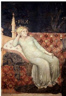
Lámina 3. Detalle de la “Paz” dentro de Alegoría del buen gobierno: La comuna de Siena de Ambrogio Lorenzetti (Palazzo Pubblico in Siena).