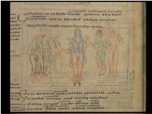
Lámina 2. Psychomachia de Prudencio (Cambridge, Parker Library, MS 23)