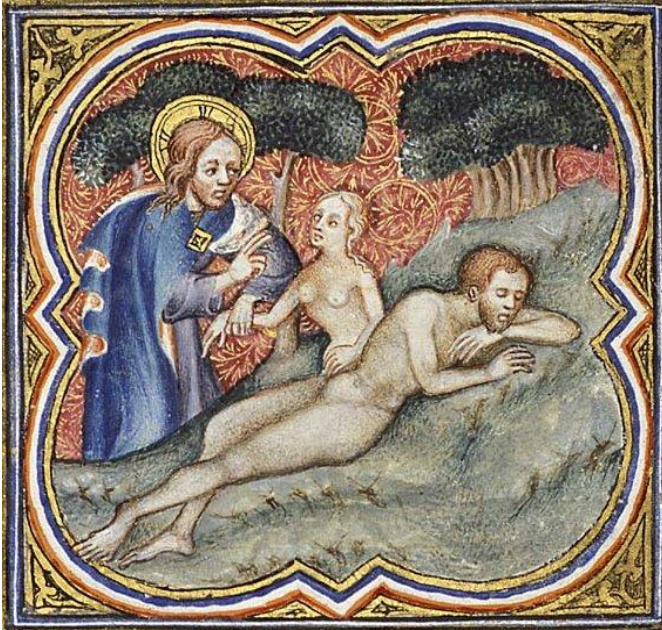
Lámina 6. Jean Bondol, Bible historial . París, 1372.