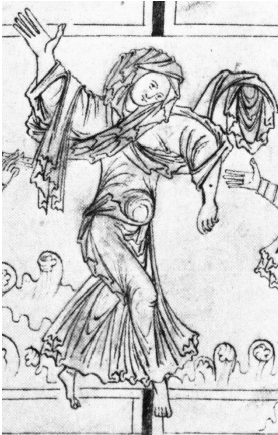
Lámina 1. “Lujuria” en la Psicomachia (Backhouse et al).